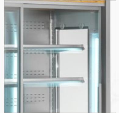
Illumination LED sur les cotés