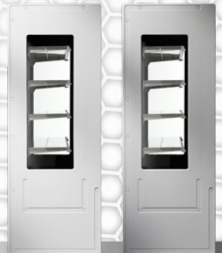
Couleur des joues latérales: blanc ou gris