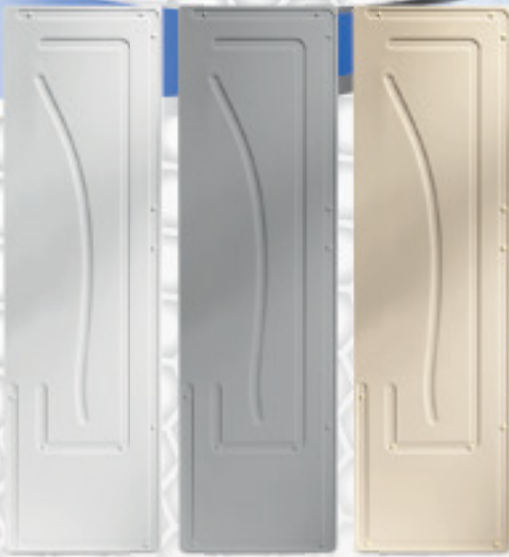
Couleur des joues latérales: blanc, gris ou poudre

Option: Séparations en plexiglas pour l'étagère