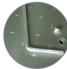
Sol en inox