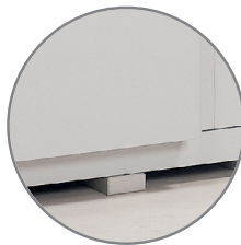
Profilé vide sanitaire