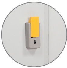
Serrure à clé