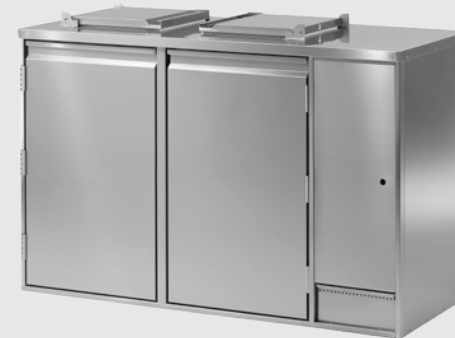
Modell 2-120-ZK-I B 1650 x T 730 x H 1060 2-240-ZK-I B 1710 x T 870 x H 1200