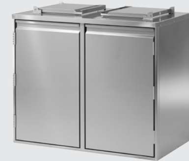
Modell 2-120-ZK B 1300 x T 730 x H 1060 2-240-ZK B 1370 x T 870 x H 1200