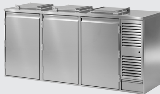
Modell 3-120-A B 2300 x T 730 x H 1060 3-240-A B 2390 x T 870 x H 1200