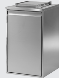
Modell 1-120-ZK B 650 x T 730 x H 1060 1-240-ZK B 680 x T 870 x H 1200