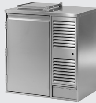
Modell 1-120-A B 1000 x T 730 x H 1060 1-240-A B 1030 x T 870 x H 1200