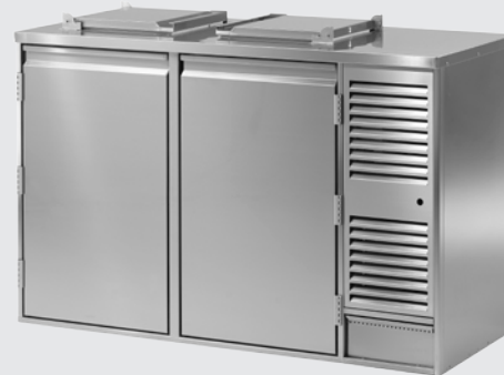
Modell 2-120-A B 1650 x T 730 x H 1060 2-240-A B 1710 x T 870 x H 1200