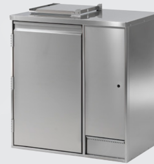
Modell 1-120-ZK-I B 1000 x T 730 x H 1060 1-240-ZK-I B 1030 x T 870 x H 1200