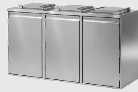
Modell 3-120-ZK B 1950 x T 730 x H 1060 3-240-ZK B 2040 x T 870 x H 1200