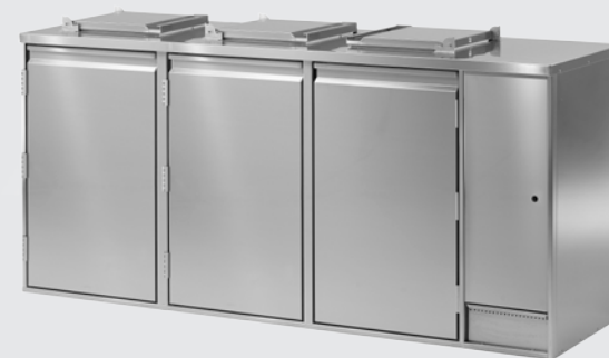
Modell 3-120-ZK-I B 2300 x T 730 x H 1060 3-240-ZK-I B 2390 x T 870 x H 1200